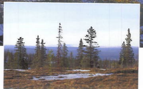
Utsikt sørover mot Rensfjellet