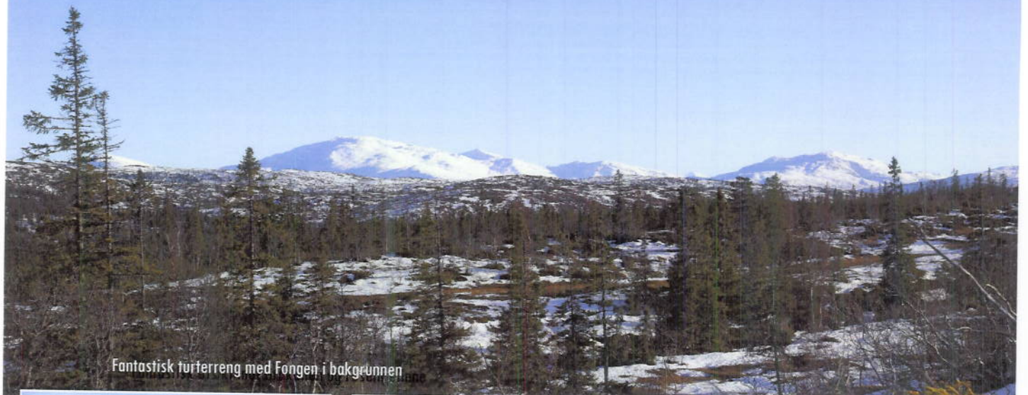
Fantastisk turterreng med Fongen i bakgrunnen