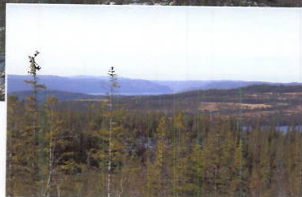
Utsikt retning Hersjøen/ Selbusjøen